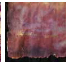
Marianna stampe-pittoriche 50x50 cm da Polaroid SX-70 "Spiccando il volo..."