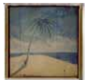
Ettore - Polaroid 600 "Bianco e Azzurro"