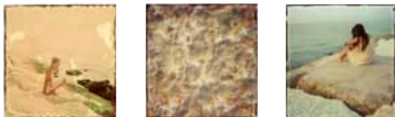
Ettore e Marianna - stampe pittoriche 50x50 da Polaroid 600 "Colori del Mare"