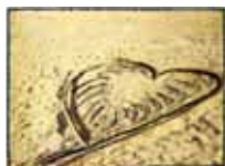
Alice Polaroid 500 "Cuore di Sabbia"