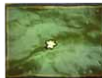
Alice Polaroid 500 "Dono al Mare" "Tra Onde e Cielo"