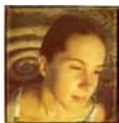
Marianna stampa-pittorica 80x110 cm da Polaroid 500 "Angeli Solari"