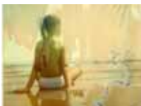
Marianna Polaroid 600 "Sogni in riva al Mare"