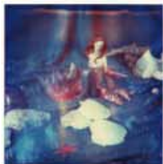
Alice stampa-pittorica 60x60 da Polaroid SX-70 "Frammenti di Mare"