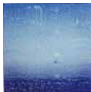
Marianna stampe-pittoriche 50x50 cm da Polaroid SX-70 "Brezza Marina"