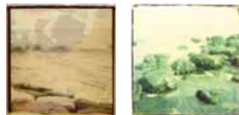
Ettore - Polaroid 600