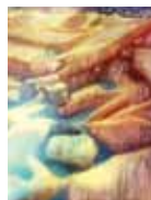
Alice Polaroid SX-70