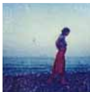
Marianna Polaroid SX-70