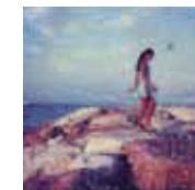
Marianna - stampe pittoriche 80x80 cm da Polaroid SX-70