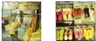
Alice - Polaroid 600 "vita DA spiaggia"