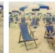
Ettore - Polaroid 600 "Solitary Beach"