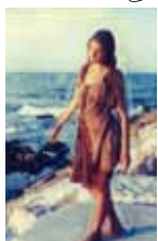
Marianna stampa-pittorica 80x110 cm da Polaroid SX-70 serie "Brezza Marina"