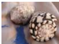
Ettore scatto digitale