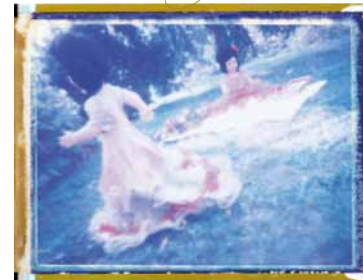
Polaroid Blue di Marianna Battocchio Testi di Mosè Battocchio