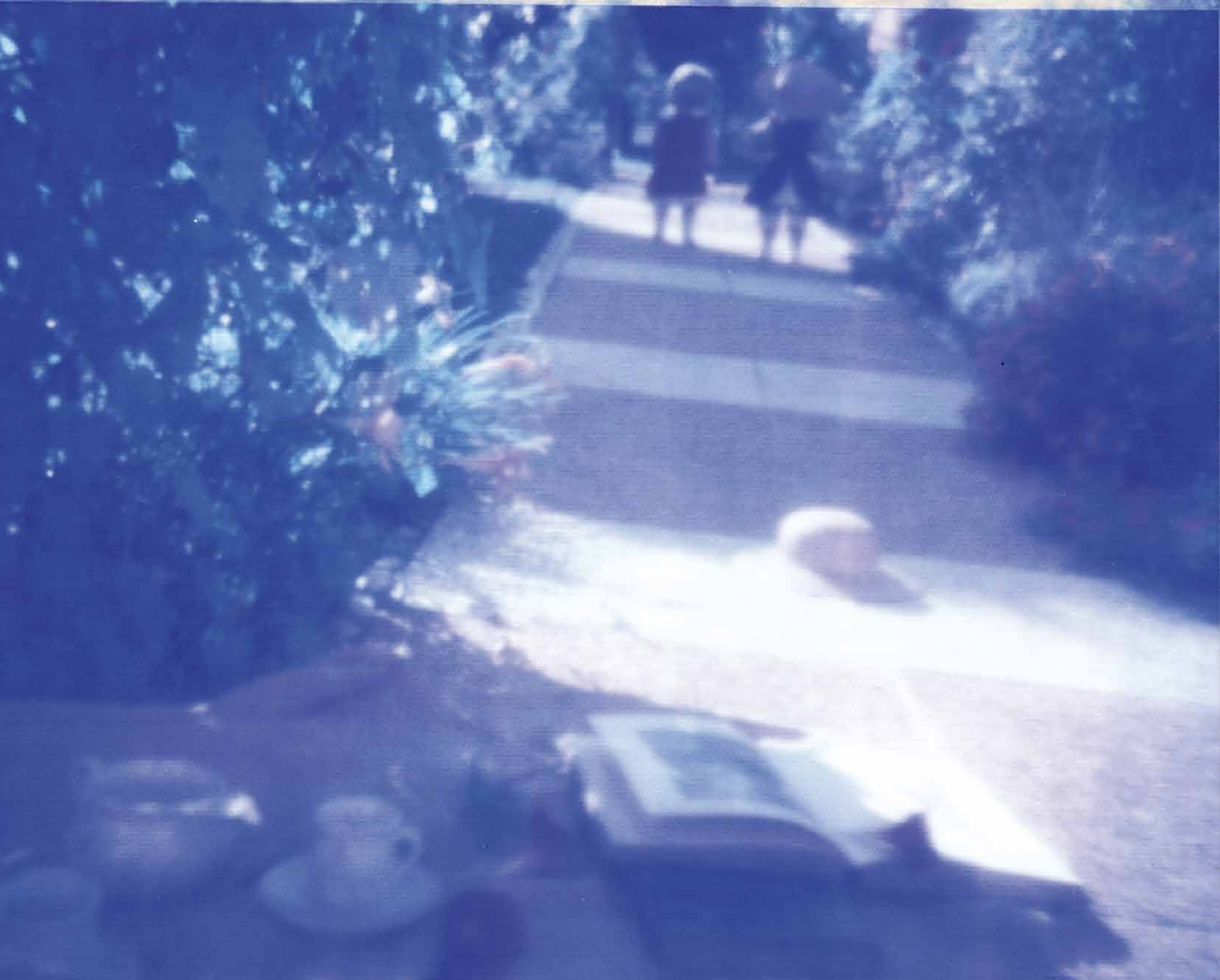
A person in a white dress sitting on a lawn with other people in the background.