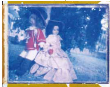
Polaroid Blue di Marianna Battocchio Testi di Mosè Battocchio