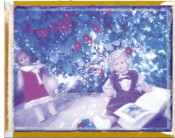
Polaroid Blue di Marianna Battocchio Testi di Mosè Battocchio